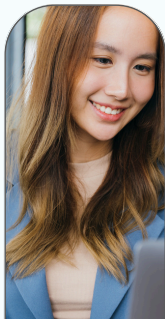
Finance & Ressources Humaines