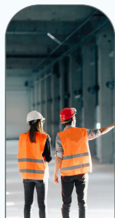
Achats industriels & spécifiques

60 catégories d'achats dans 6 domaines d'intervention