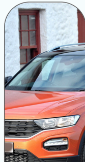
Véhicules & Transports

Nous négocions régulièrement les meilleures conditions tarifaires auprès de plus de 100 fournisseurs