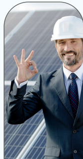
Maintenance & Entretien des locaux